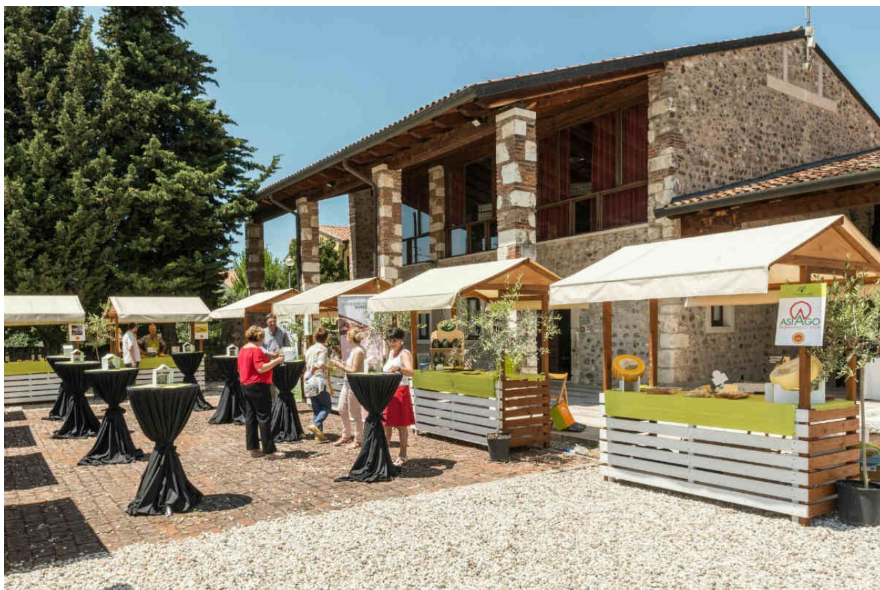
WardaGarda, due giorni dedicati all'olio Garda Dop.

Per tutte le informazioni: wardagarda.it .